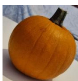
Vente de citrouilles à sculpter

L'association des Marmots de nos villages compte 35 familles adhérentes pour l'année scolaire 2022-2023. L'association fonctionne grâce à un bureau de 6 membres exécutifs bénévoles et est financée par les cotisations (10€/famille) et la participation des enfants scolarisés à l'école de Villeneuve-sur-Verberie et leur famille aux différents événements. Depuis la rentrée, plusieurs actions ont eu lieu :