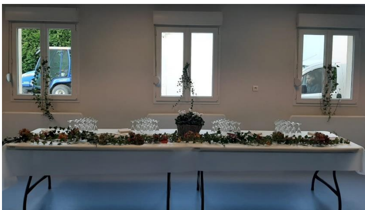
LE BUFFET DU REPAS DES ANCIENS