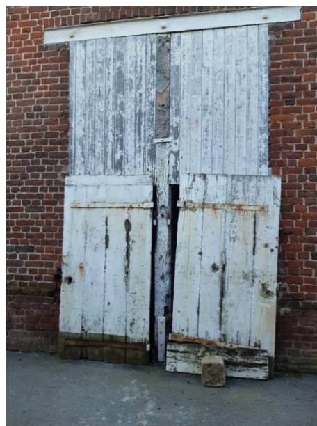
La porte actuellement, dans l'attente d'être changée